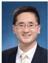
陳百里博士 香港特別行政區政府 署理商務及經濟發展局局長