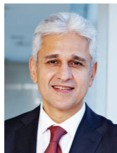
羅士德先生 雀巢大中華區董事長 兼首席執行官