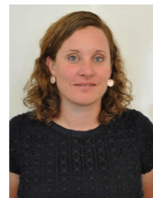
龍麗蓮女士 瑞典駐華使館參贊 及企業社會責任中心負責人